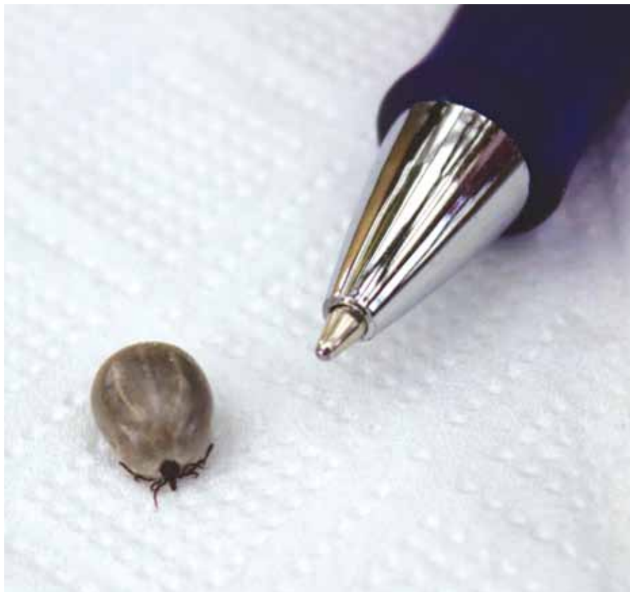
Hver gang flåten har spist et måltid, lader den sig falde til jorden, hvor den fordøjer blodet. Så kravler den op i lav, knæhøj vegetation som græs og andre skovbundsplanter, hvor den sidder og venter på næste offer. Når hunnen har fået sit tredje måltid, lægger hun op til 2.000 æg under nedfaldne blade.

”TBE er en meget sjælden sygdom, og det er endnu sjældnere, at man rent faktisk bliver syg, selv om man skulle